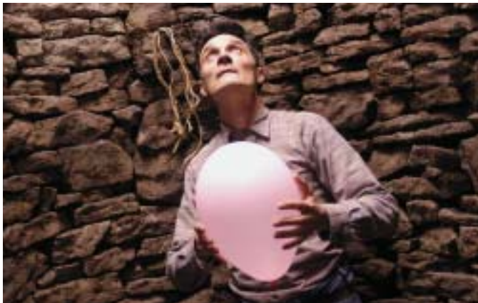
CACHE CACHE