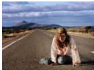
WOLF CREEK

La jeune Machi invente des histoires fantastiques avec ses amis : chacune à sa manière poursuit ces récits imaginaires qui tissent entre elles un lien invisible. Un jour, une tempête