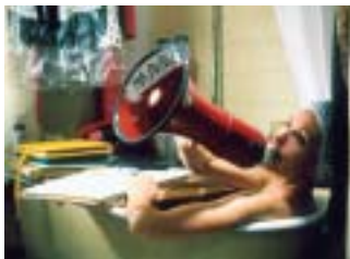
TRAVAUX, ON SAIT QUAND ÇA COMMENCE...

Un jeune cinéaste, qui n'a pas les moyens de financer son film, parcourt la ville de Tbilisi transformée en un grand marché : un professeur tient une échoppe tandis qu'un ancien marchand siège au Parlement. Dans la capitale peuplée de