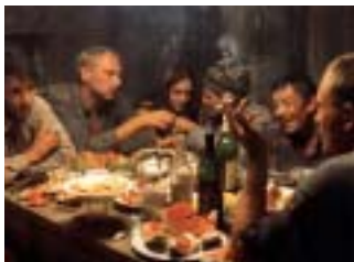
SEVEN INVISIBLE MEN