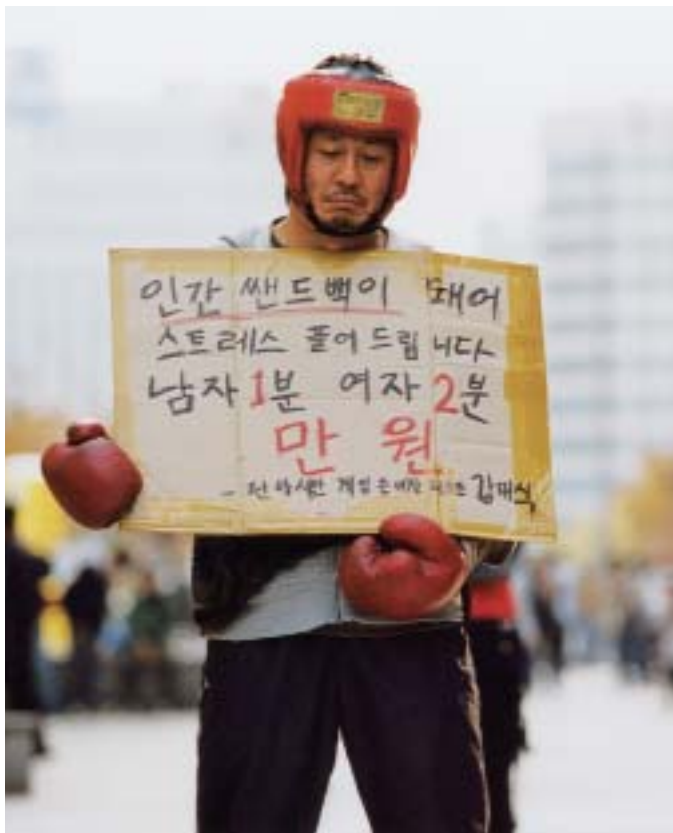
CRYING FIST