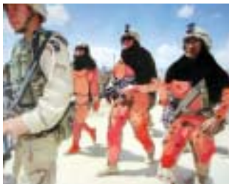
COSMETIC EMERGENCY

À travers l'obsession de la chirurgie esthétique et l'immortalité de la peinture, une exploration de "ce qu'il y a à l'intérieur". La beauté en question.