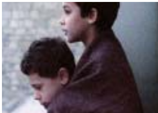
À BRAS LE CORPS